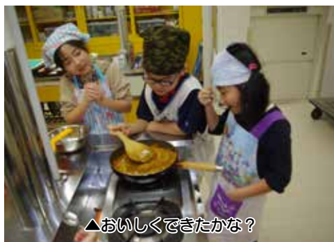
▲おいしくできたかな？

できあがったカレーはご飯と一緒に皿に盛り、思い思いにブロッコリーなどを飾り付けし、最後に全員で食べました。