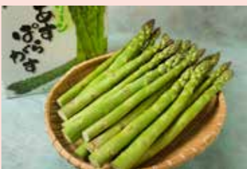
▲今年から事前予約を始めたグリーンアスパラ1kg