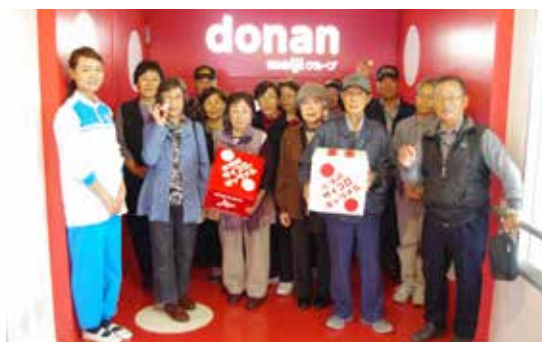
滝瀬地区高齢者大学視察研修 (函館市 道南食品工場見学)