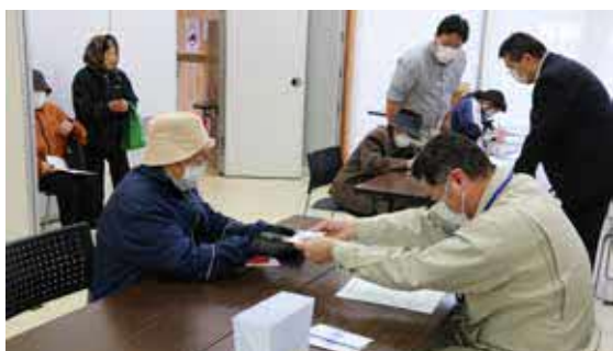
商品券を笑顔で受け取る町民

町では、今後さらに新型コロナウイルスの感染拡大防止策はもちろん、追加の経済支援などに取り組み予定です。