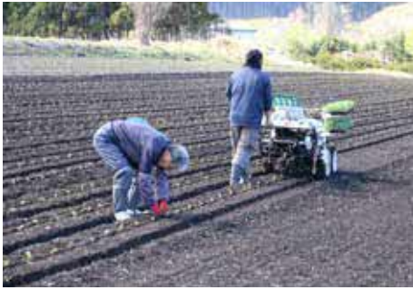
ブロッコリーの定植作業

るのは天候です。生育中に雨が続き、低温等の影響で病気になる可能性も、売り物にならなくなることもあり、雨が多い年は生産量が伸び悩みます。 ブロッコリーは農業経営の安定化を図るために農業再生プランを策定し、輪作体系の確立や低温に強い品種の改良、契約栽培などを行い、主な出荷先である青果専門商社により、首都圏のスーパーを中心に販売されています。 今年のアスパラガスやブロッコリーを始めとした乙部町の農作物が豊作となり、美味しい野菜が食べられることを楽しみにしています。