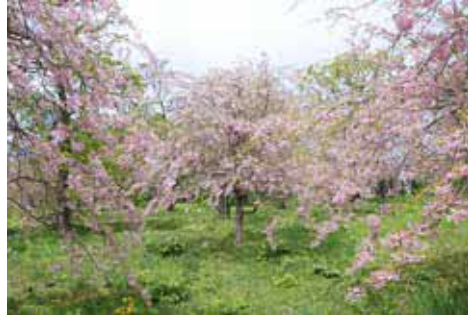
しびの岬公園の桜

残念ながら、外出自粛等のため、見に行けるタイミングがなく、毎年「青少年を守る会」で行っているお花見会も開催できませんでしたが、来