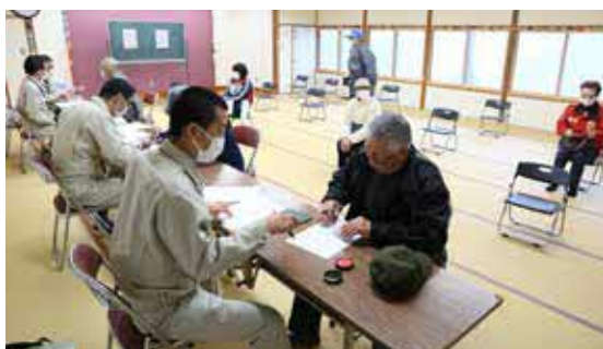
スマイル商品券の申請会場