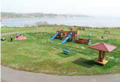
緑地広場の新しい遊具