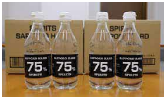
寄贈された SAPPORO HARD 75%

札幌酒精工業では、四月十日に厚生労働省医政局から「新型コロナウイルス感染症の発生に伴う高濃度エタノール製品の使用について」の通知があり、酒類製造業者においても高濃度アルコールを消毒用エタノールの代替品として手指消毒に使用できることになり、四月二十七日より「SAPPORO HARD