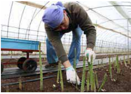
アスパラガスの春芽収穫作業