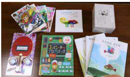
寄贈された図書と卓球ラケット