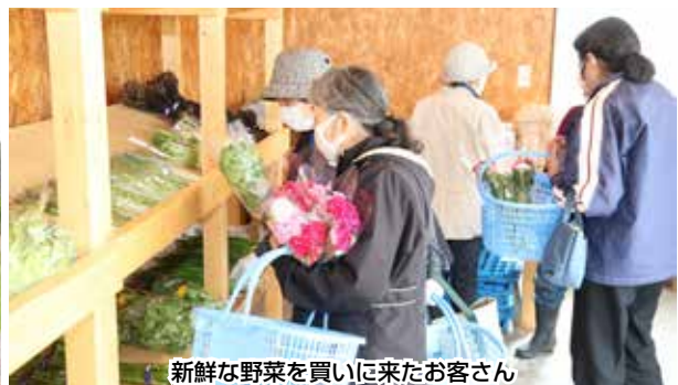
新鮮な野菜を買いに来たお客さん