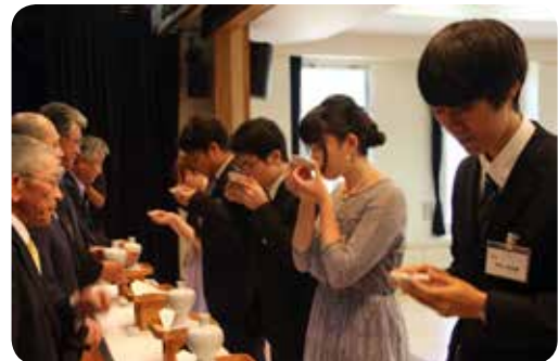
昨年の「成人のつどい」