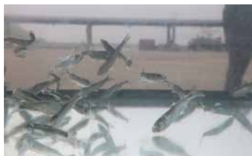
放流するニシンの稚魚

平成二十八年から毎年、せたな町にある「北海道栽培漁業振興公社瀬棚事業所」で生産した百万尾の稚魚を檜山で本格的に放流し始めました。 放流されたニシンは、約三〜四年で成体となり、産卵のために生まれ育った海に帰ってくるとされています。檜山管内では、ニシンの漁獲量が増え続けていて、乙部町でも少しずつ増えているので、ニシンで栄えた時代の海が、この活動により戻ってくることを願っています。