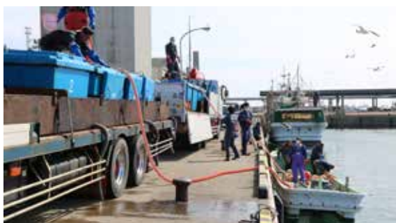
タンクから乙部漁港内へ放流