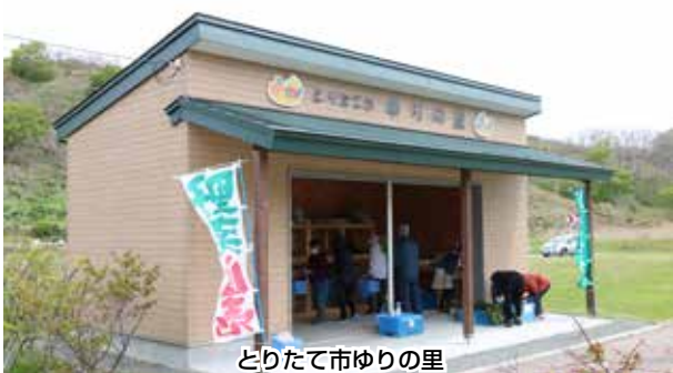
とりたて市ゆりの里

販売は、毎週土・日曜日の午前十時から始まり、新型コロナウイルスや野菜の状況を確認しながら、十月末頃まで行う予定です。