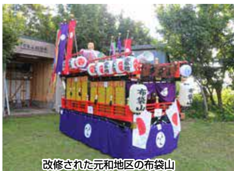
改修された元和地区の布袋山

住民が自主的に行うコミュニティ活動の促進として、元和自治会では、祭りで使う山車本体や提灯、スピーカー、五色旗などの改修が行われ、地域の活動がより活発になることが期待されています。