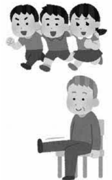
健康づくりのための身体活動基準 (厚生労働省)