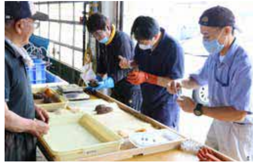
ナマコにホルモン剤を注射

誘発させ、オスとメスを判断しました。 その後、メスをタンクに移し、各オスから抽出した精子を混ぜて受精させ、二週間ほど籠に定着するまで成長してから、十九日に乙部漁港内に設置しました。 ひやま漁業協同組合乙部地区ナマコ振興協議会では、一タンク当たり百万粒の種苗を百タンクほど用意し、乙部の海に放流しており、漁獲できる大きさになるまでには、約六～七年ほどかかるため、徹底した資源管理に努めています。