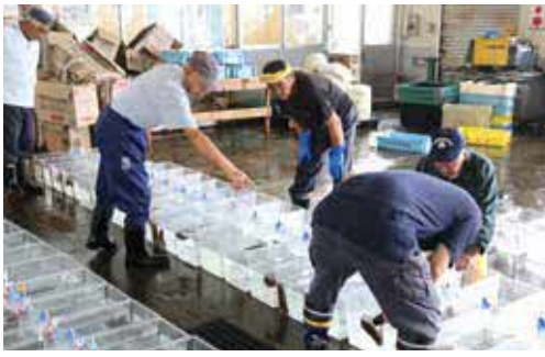
ナマコのオスとメスを判別

乙部のナマコは、イボ立ちが良く、漁業者が自ら種苗生産から放流、加工、販売まで行っており、乾燥ナマコ「檜山海参（ヒヤマハイシエン）」は、令和二年三月三十日に農林水産省の地理的表示保護制度（GI）の対象産品に登録され、全国的に注目を集めています。