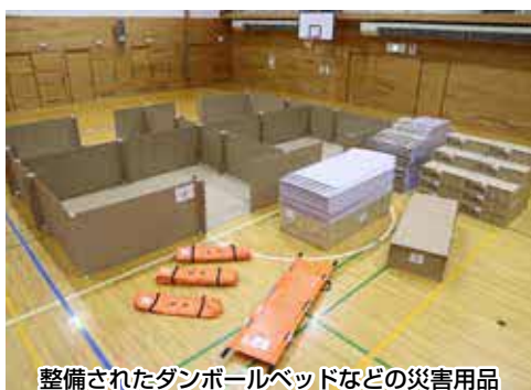
整備されたダンボールベッドなどの災害用品

地域の防災活動に必要な設備等として、乙部町自治会町内会連合会では、ダンボールベッドや災害用敷マット、避難所ボード、折りたたみ担架を整備し、地域防災の向上に努めました。