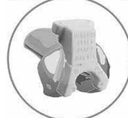
術前ナビゲーション