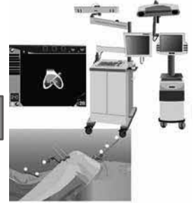
術中ナビゲーション

人工膝関節置換術には、さまざまな手術器械が使用され、患者さんの安全性を確保しています。当院では事前の画像検査によって得られた患者さんの個々のデータから、 3Dプリンター を使って、ひとり一人の膝の状態に合わせた手術器械を作製することができるようになりました。