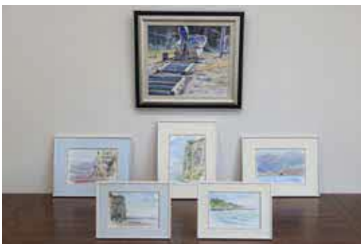
寄贈された水彩画

町長からは「乙部町を題材とした素敵な絵を多く寄贈いただき嬉しく思います。町民の皆さんにも見ていただければ、大切に展示させていただきます」と感謝の気持ちを伝えました。 寄贈された水彩画は、準備ができ次第、町内施設へ展示します。