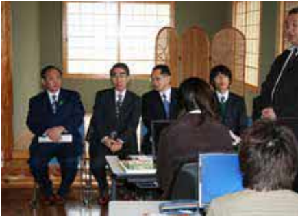
IT研修施設で研修生と懇談の様子