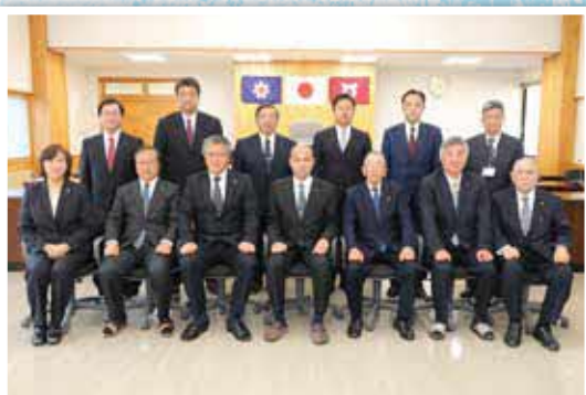
平成から令和に変わり、乙部町も町長と議員が新体制でスタートしました