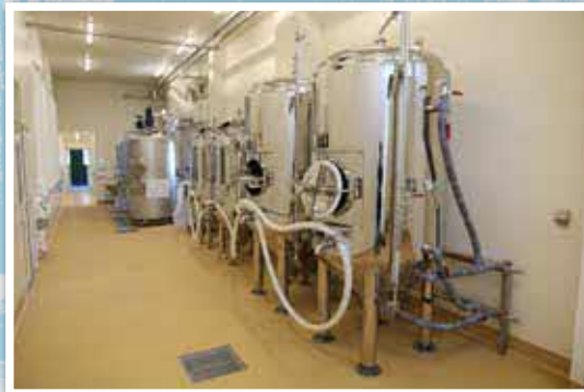
新たな企業誘致や集会施設の整備など、活気ある町づくりを推進してきた