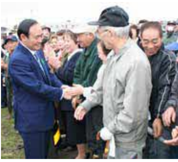
町民と握手する菅大臣

平成十九年四月十五日に、当時総務省が進めていた頑張る地方応援プログラムの一環として「頑張る地方応援懇談会in北海道」が北斗市で開催され、懇談会終了後に頑張っている自治体として、菅総務大臣が乙部町を視察に訪れま