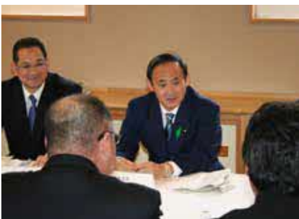
漁業者と意見を交わす菅大臣

国の仕事は、地域が発展していく環境を整備していくことなので、これからもどんどん要望をあげてください」と話し、多くの町民に見送られながら視察を終えました。