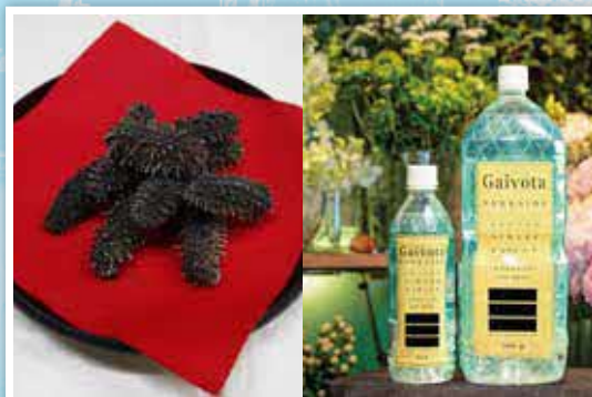
乙部町の特産品が国や道から認定されるなど、全国的に注目され始めています。

昭和四十年十月一日に、乙部が「村」から「町」に変わって五十五周年を迎えました。五十五周年を迎えたときに「乙部町町制施行五十年史」を発行していますので、発行から五年間の出来事を一部紹介します。